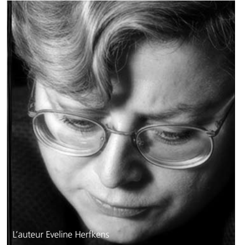
L'auteur Eveline Herfkens

Depuis que les objectifs du Millénaire pour le développement (OMD) ont été convenus en 2000, de nombreux pays en développement ont fait de grandes avancées. Le monde était sur la bonne voie pour réaliser au moins le premier Objectif du Millénaire, qui vise à réduire de moitié le nombre de personnes vivant dans l'extrême pauvreté, et était proche également de la réalisation de plusieurs autres objectifs. Toutefois, la crise actuelle est en train d'anéantir les progrès réalisés après maints efforts. L'accès des pays pauvres au crédit a été réduit, se traduisant par un ralentissement de l'investissement et de la croissance ; les niveaux d'aide publique au développement (APD), déjà dérisoires, sont en train de chuter ; et l'Afrique pourrait être privée de sa seule chance, pendant cette génération, de réaliser de réels progrès. Dans le même temps, le monde manque d'un système efficace de gouvernance mondiale. Les trois déficits du système que j'expose ci-dessous ont dans le passé entravé la structure, mais sont particulièrement paralysants dans la situation actuelle.