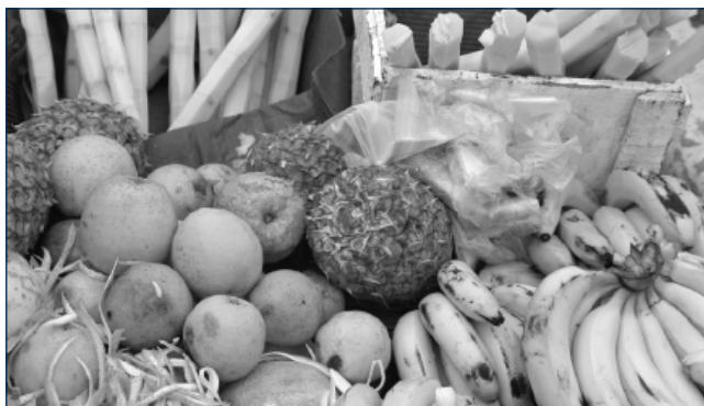
Les exportations majeures du CARICOM vers l'UE incluent le sucre, la banane et le rhum.

En troisième lieu, la combinaison de l'érosion des préférences et du fléchissement séculaire des prix des produits agricoles contraint la région à diversifier sa base d'exportation et à tirer davantage de valeur de ses biens exportables. En 2005, les six exportations majeures du CARICOM vers l'UE étaient les suivantes : l'alumine (15,6% de part des exportations); le rhum (11,3%); le pétrole (11,1%); le sucre (9,5%) et le gaz naturel (4,7%). La performance de